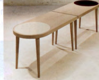
Demir Obuz tasarımı Visavis, Ilio.