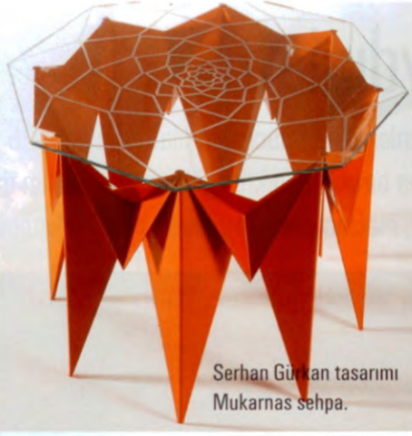
Serhan Gürkan tasarımı Mukarnas sehpa.